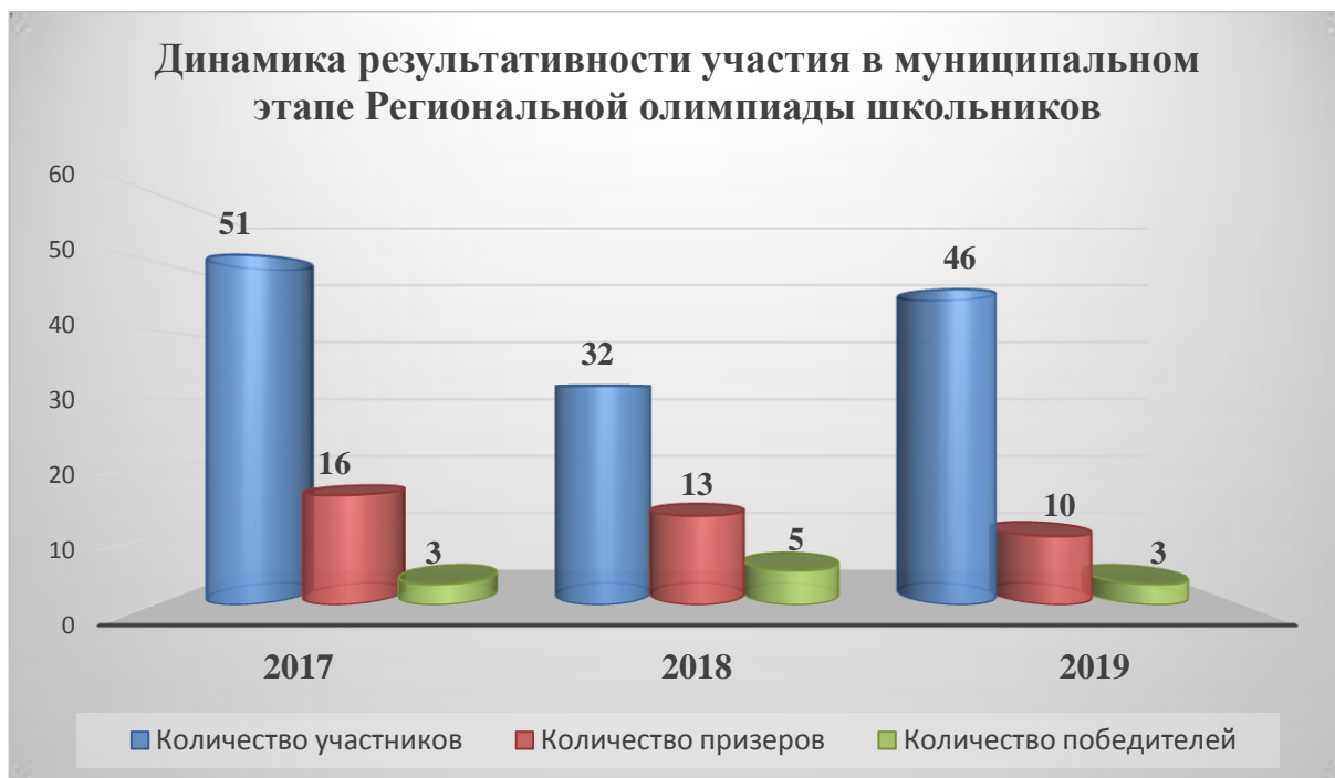
Сравнительная таблица (результатов заключительного этапа Региональной олимпиады школьников за 3 года)