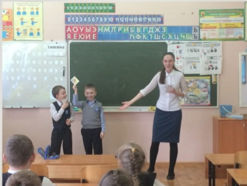
Турнир первоклашек «I know the ABC» (внеурочная деятельность)