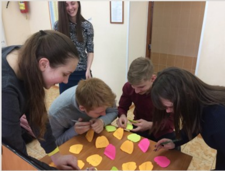
Совместная подготовка тематической лексики для игры «Алеас»