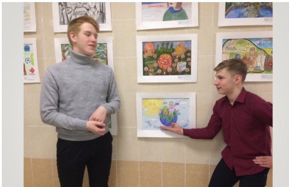
Экскурсия по школьной выставке рисунков