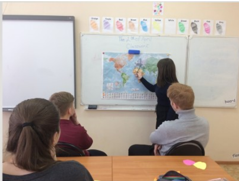
Путешествие по англоговорящим странам