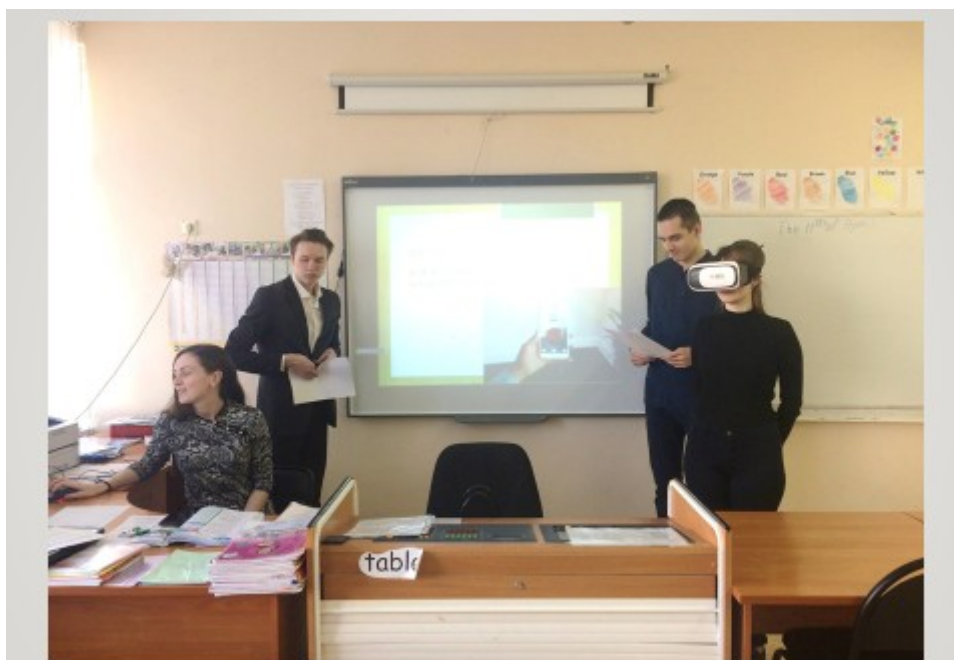
Путешествие в мир виртуальной реальности

Что же касается самообразования, которое не менее важно для того, чтобы быть современным педагогом, хочу упомянуть и о прошедшем недавно семинаре для молодых педагогов.