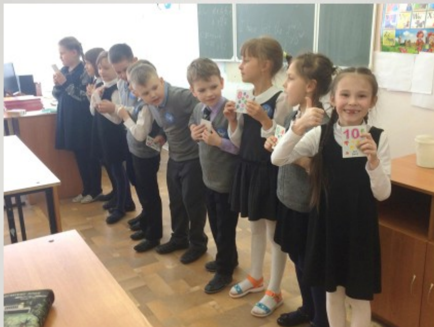
Игра «цифровая змейка»